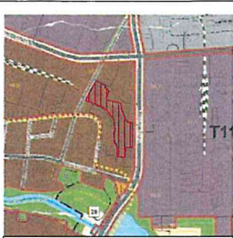
IŠTRAUKA IŠ PANEVĖŽIO M. BENDROJO PLANO KEITIMO