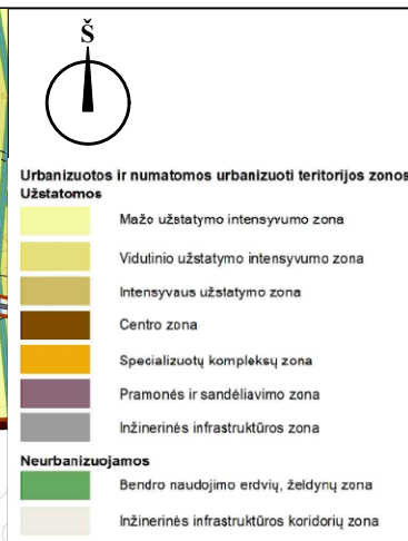
Planuojamos teritorijos situacija Panevėžio miesto teritorijos bendrojo plano keitimo pagrindiniame žemės naudojimo ir apsaugos reglamentų brėžinyje