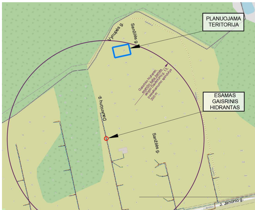
2 pav. Artimiausias gaisrinis hidrantas Daukniūnų g., pagrindas: inžinerinių tinklų žemėlapis.

Gaisro plitimas į gretimus pastatus ribojamas užtikrinant saugius atstumus tarp pastatų lauko sienų. Numatomiems pastatams nustatant statybos zoną, ribą ir linijas, pagal pastatams keliamus priešgaisrinių atstumų reikalavimus, leidžiama pasirinkti norminius minimalius gaisrinius atstumus, vadovaujantis Reglamentu: