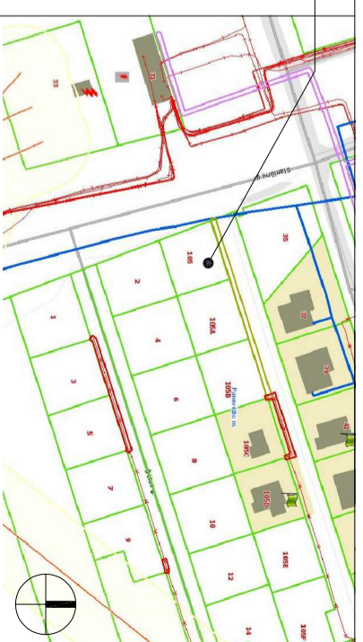
Žemės sklypo Panevėžio mieste (kadastro nr. 2701/0039-258) detalusis plano korektūra

KOREGUOJAMAS DETALUSIS PLANO SPRENDINYS Vadovaujantis Lietuvos Respublikos teritorijų planavimo įstatymo 28 straipsnio 3, 8, 9 dalimis, Kompleksinio teritorijų planavimo dokumentų rengimo taisyklių, patvirtintų Lietuvos Respublikos aplinkos ministro 2014 m. sausio 2 d. įsakymu Nr. D1-8 „Dėl Kompleksinio teritorijų planavimo dokumentų rengimo taisyklių patvirtinimo“, 318.3.1, 318.3.3 ir 318.3.4 papunkčiais Statybos zonos, ribos keičiamas.