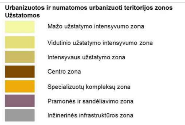
Planuojamos teritorijos situacija Panevėžio miesto teritorijos bendrojo plano keitimo pagrindiniame žemės naudojimo ir apsaugos reglamentų brėžinyje