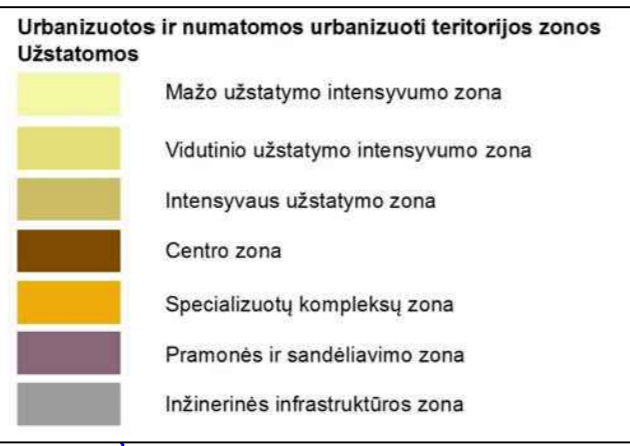
Planuojamos teritorijos situacija Panevėžio miesto teritorijos bendrojo plano keitimo pagrindiniame žemės naudojimo ir apsaugos reglamentų brėžinyje