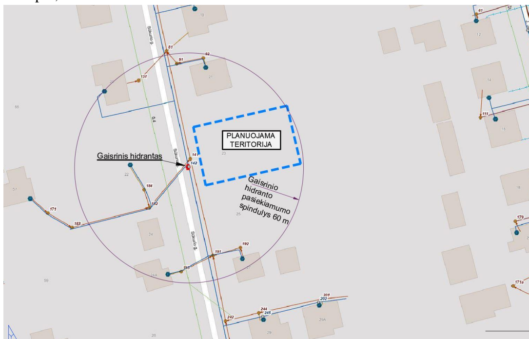
2 pav. Gaisrinių hidrantų schema, pagrindas: Inžinerinių tinklų žemėlapis.

Gaisrinė sauga sprendžiama vadovaujantis Gaisrinės saugos normų teritorijų planavimo dokumentams rengti reikalavimais (patvirtintais Lietuvos Respublikos aplinkos ministro ir Priešgaisrinės apsaugos ir gelbėjimo departamento prie Vidaus reikalų ministerijos direktoriaus 2013 m. gruodžio 31 d.). Gaisrų gesinimui vandens paėmimas numatytas iš gaisrinio hidranto, esančio Sūkurio g., vandentiekio šulinio Nr. 142, pasiekiamumo spindulys 60 m, 2 pav. Vadovaujantis Priešgaisrinės apsaugos ir gelbėjimo departamento prie Vidaus reikalų ministerijos direktoriaus įsakymu „Dėl normatyvinių statinio saugos dokumentų patvirtinimo“, 2007 m. vasario 22 d. Nr. 1-66, suvestinė redakcija nuo 2016-05-01, 74 punktu: „Užstatytose pastatais ir statiniais teritorijose gaisriniai hidrantai vandentiekio tinkluose turi būti įrengiami kas 150–200 m. Atstumas, skaičiuojant jį pagal ugniagesių tiesiamą vandens liniją, nuo gaisrinio hidranto iki jo saugomo pastato perimetro tolimiausio taško turi būti ne didesnis kaip 200 m.“. Esant poreikiui, rengiant statinio projektą, numatyti papildomus gaisrinius hidrantus. Įvažiavimo į žemės sklypą plotis ne siauresnis kaip 3,5 m.