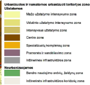
Planuojamos teritorijos situacija Panevėžio miesto teritorijos bendrojo plano keitimo Pagrindiniame žemės naudojimo ir apsaugos reglamentų brėžinyje