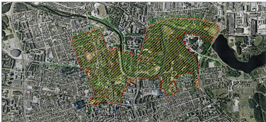
PANEVĖŽIO MIESTO ISTORINĖ DALIS (31872) APIBRĖŽTŲ TERITORIJOS RIBŲ PLANAS, 1 LAPAS. SITUACIJOS PLANAS Panevėžio m., Panevėžio m. sav.

Nustatytos Panevėžio miesto istorinės dalies ribos apima istorinio branduolio teritoriją, susidariusią iš trijų gyvenviečių - Senojo Panevėžio, Naujojo Panevėžio ir Nikolajevo. Vertybės teritoriją riboja Venslaviškio g., Senamiesčio g., Smėlynės g., Gegutės g. (pietinė respublikinės Panevėžio ligoninės sklypo riba) iki Nevėžio, kitoje upės pusėje - P. Puzino g., Malūno pastato (u.k.21182) sklypas, Kranto g., Berčiūnų g., A. Mackevičiaus g., Vasario 16-osios g., A. Smetonos g., Klaipėdos g., J. Tilvyčio g., Nepriklausomybės a. sklypas ir Namų (u.k. 21650) sklypas, Vilniaus g., V. Kudirkos g., sklypų ribos V. Kudirkos gatvės tęsinyje, Elektros g., J. Basanavičiaus g. iki Nevėžio apsaugos juostos, Nevėžio apsaugos juostos riba apimant kvartalą apie Staniūnų gatvę iki Vilniaus gatvės, Skaistakalnio parko sklypo pietinė riba, J. Billiūno g. iki Venslaviškio g. (žiūr. pav.1.1.).