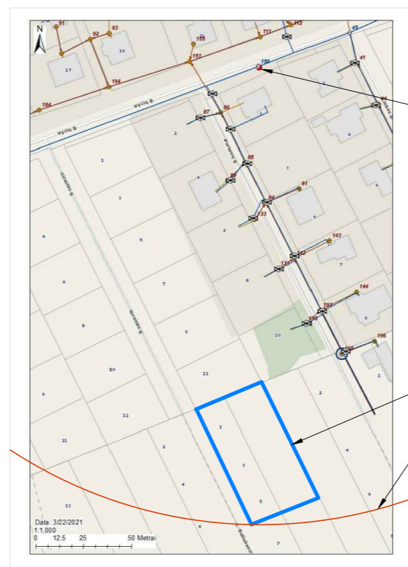
Gaisrinio hidranto pasiekiamumo schema, duomenų šaltinis UAB „Aukštaitijos vandenys“