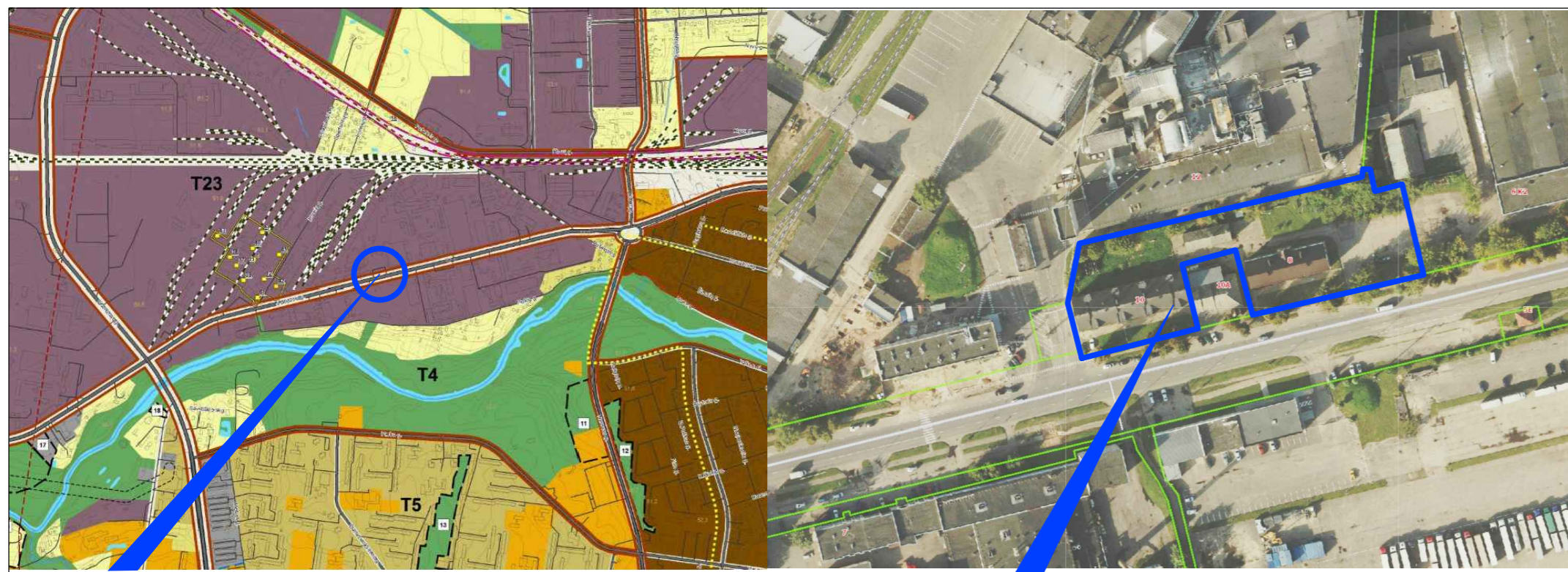
Planuojamos teritorijos situacija (Pagrindas: Panevėžio miesto teritorijos bendrojo plano keitimas, Pagrindinio žemės naudojimo ir apsaugos reglamentų brėžinio fragmentas)