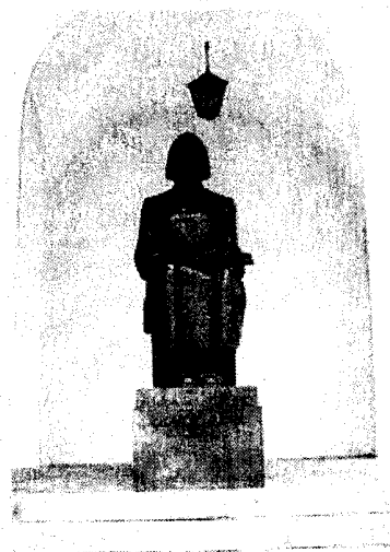
Kristijono Donelaičio skulptūra