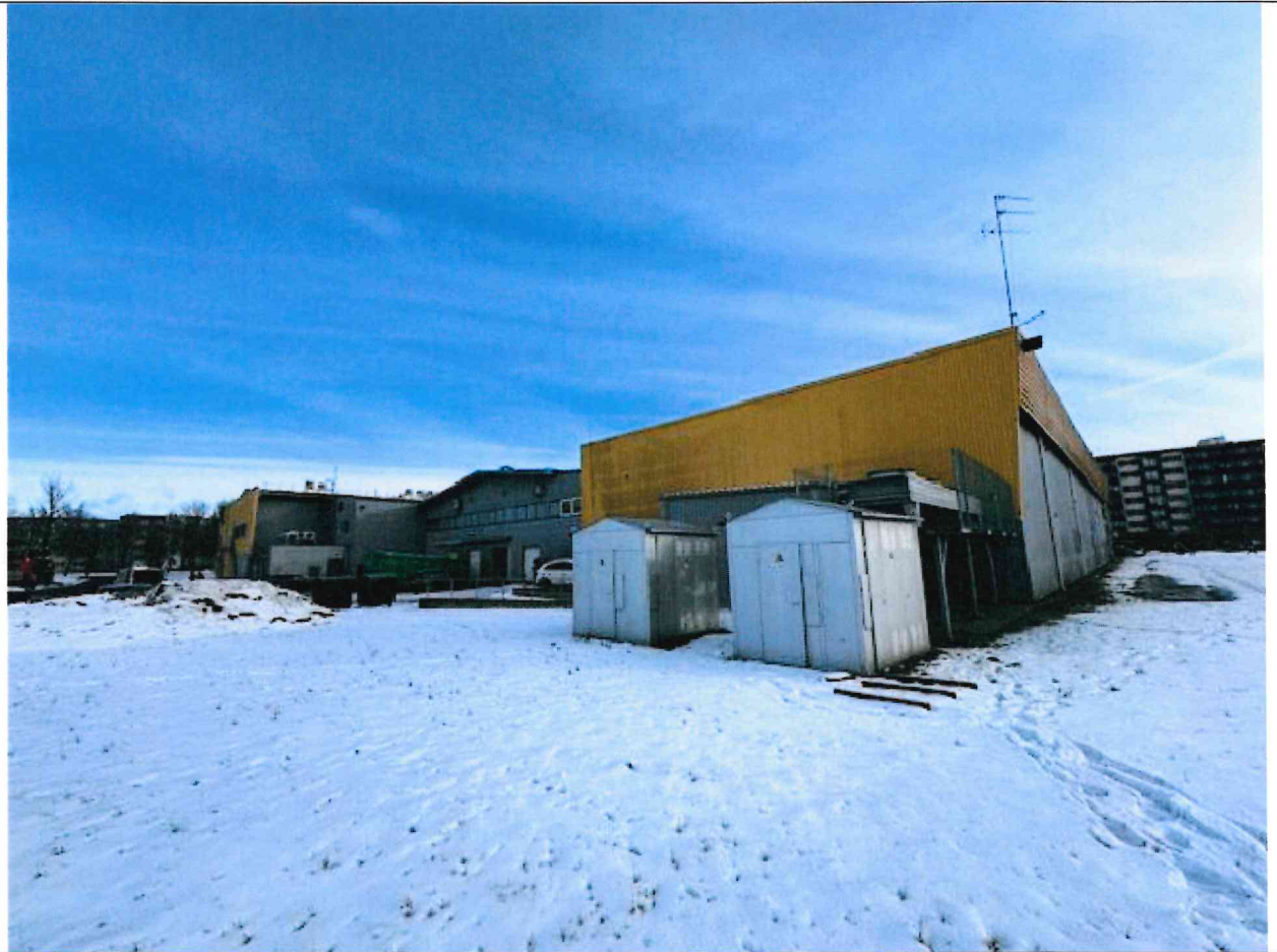
Foto lentelės prie 2024 m. vasario 12 d. patikrinimo akto Nr. ŽPa-4 tęsinys:

Nuotraukos Nr. 2 (antras) (eilės numeris ir aprašymas)