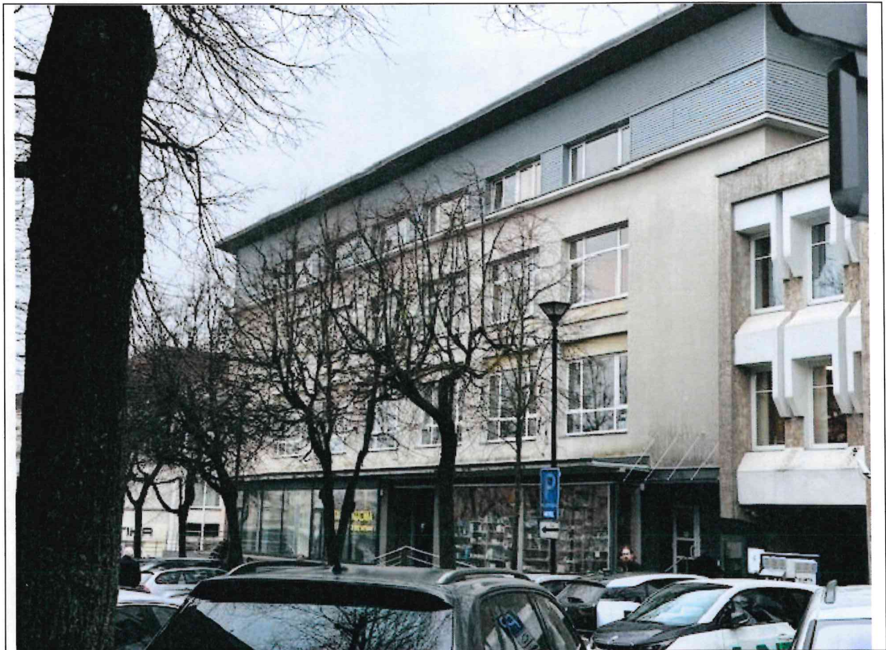
Foto lentelės prie 2025 m. kovo 13d. patikrinimo akto Nr. ŽPa-17 tęsinys:

Nuotraukos Nr. 2 (antras) (eilės numeris ir aprašymas)