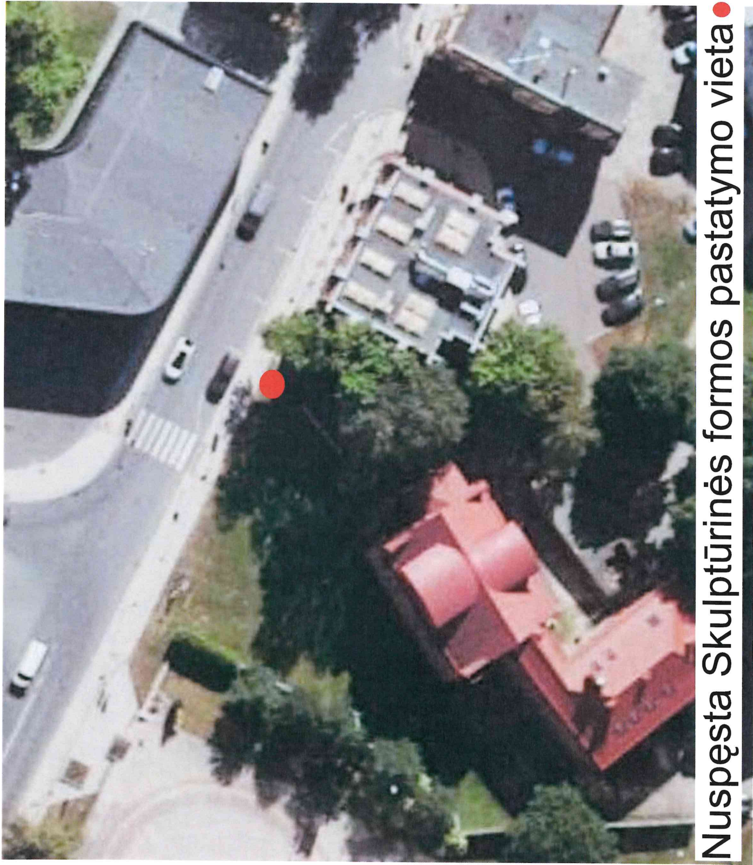
Nuspešta Skulptūrinės formos pastatymo vieta ●