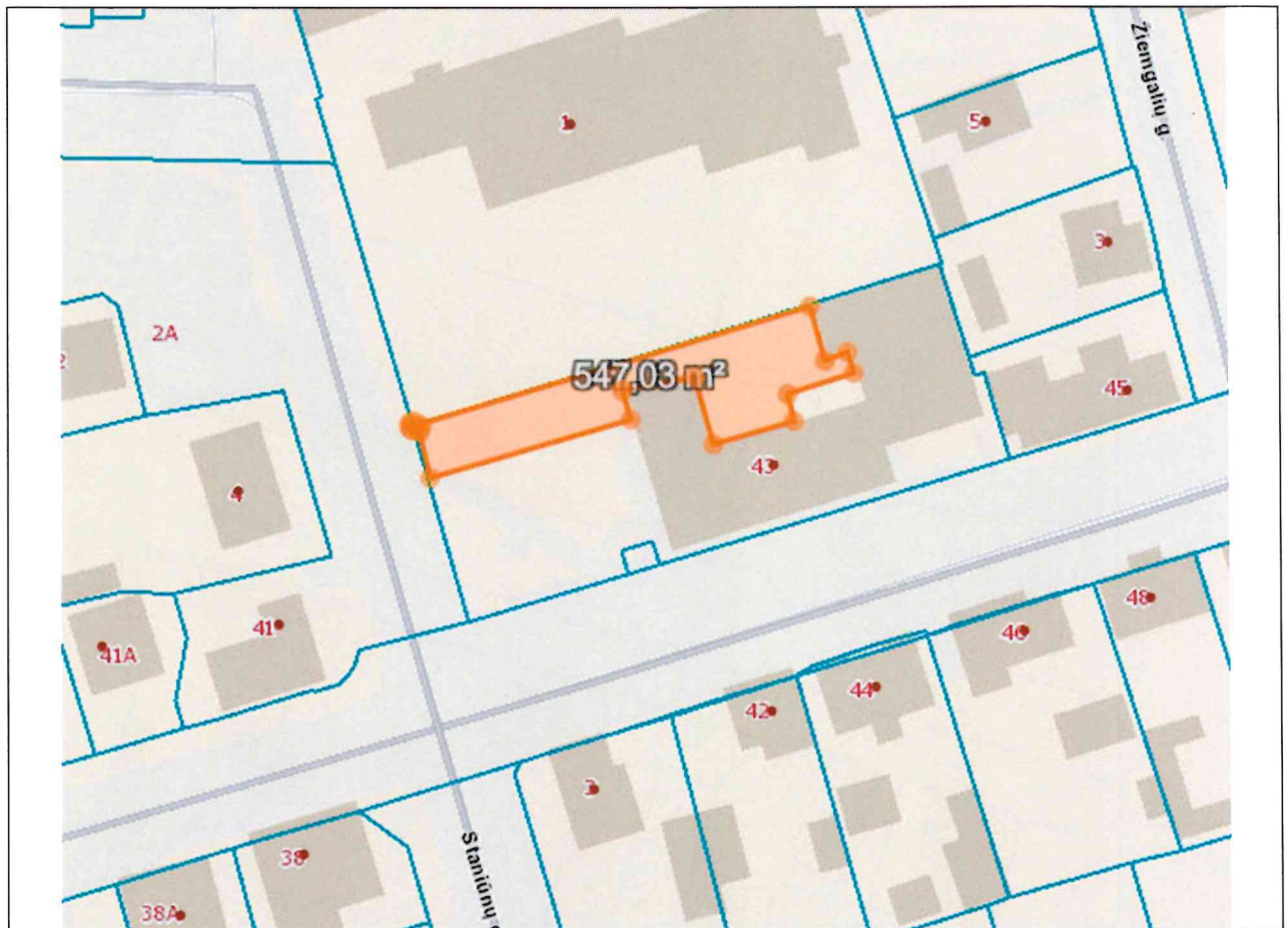
Foto lentelės prie 2026 m. sausio 14 d. patikrinimo akto Nr. ŽPa-5 tęsinys: ( data) (registracijos numeris)

Nuotraukos Nr. 8 (eilės numeris ir aprašymas)