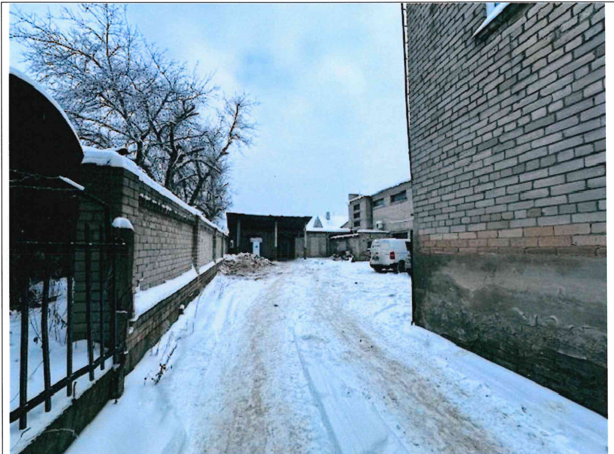
Foto lentelės prie 2026 m. sausio 14 d. patikrinimo akto Nr. ŽPa-5 tęsinys: ( data) (registracijos numeris)

Nuotraukos Nr. 4 (eilės numeris ir aprašymas)