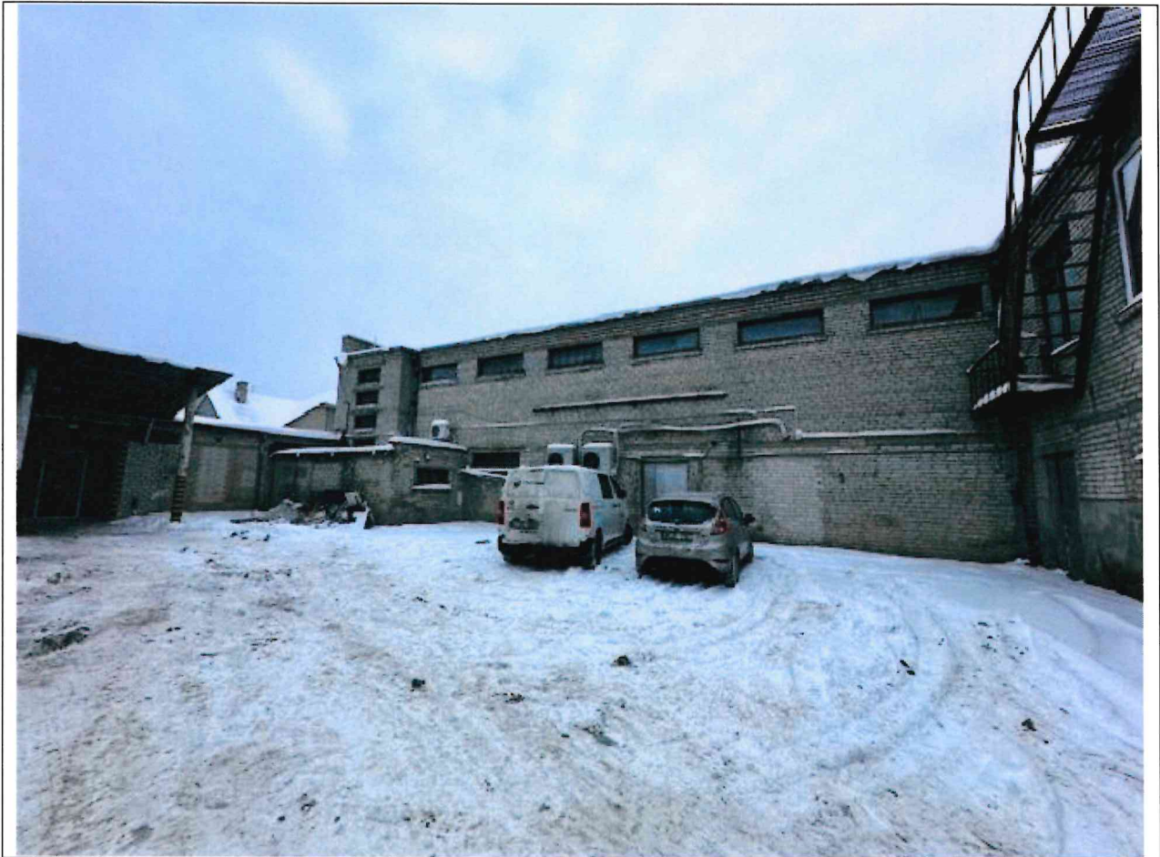
Foto lentelės prie 2026 m. sausio 14 d. patikrinimo akto Nr. ŽPa-5 tęsinys: ( data) (registracijos numeris)

Nuotraukos Nr. 5 (eilės numeris ir aprašymas)