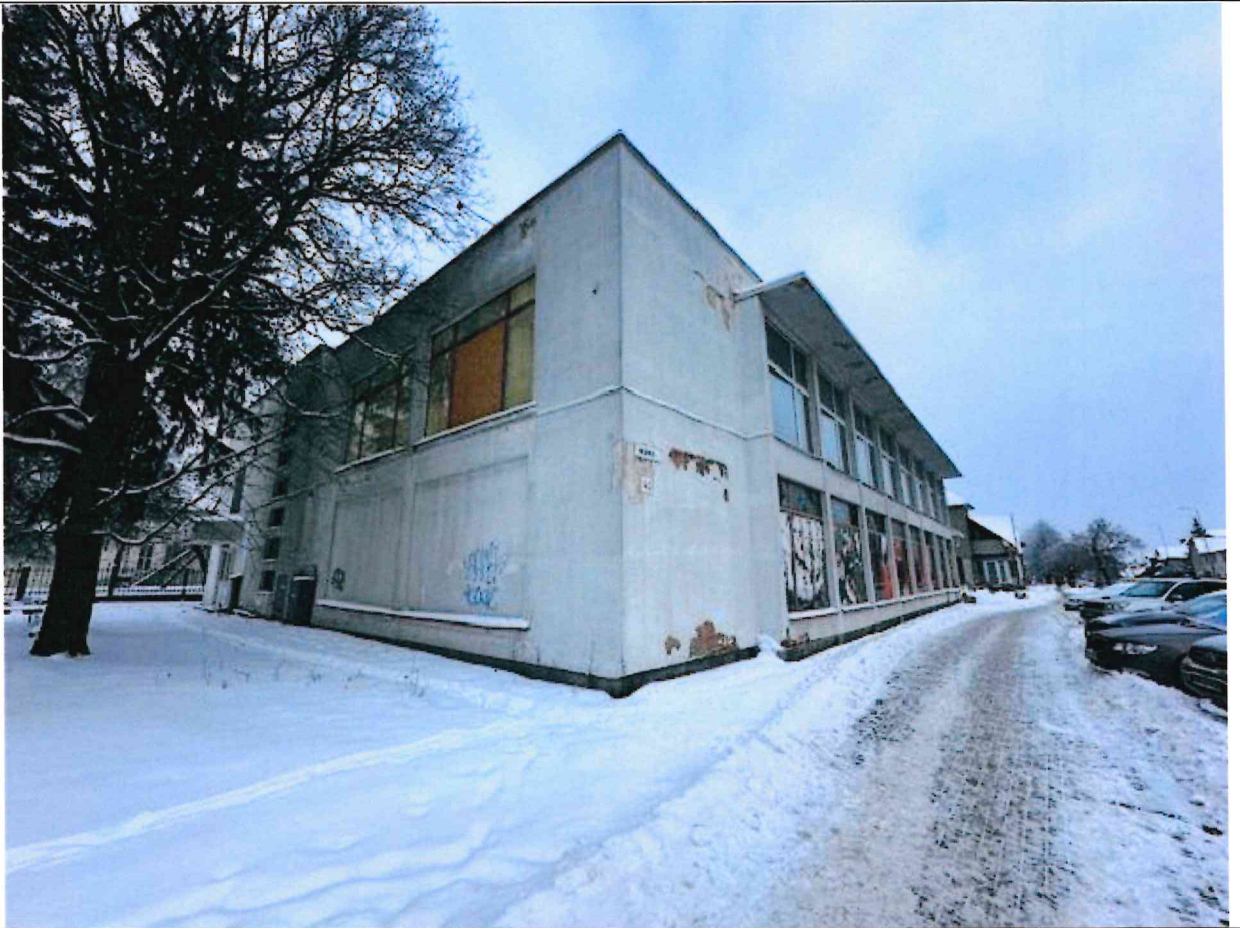
Foto lentelės prie 2026 m. sausio 14 d. patikrinimo akto Nr. ŽPa-5 tęsinys: ( data) (registracijos numeris)

Nuotraukos Nr. 2 (eilės numeris ir aprašymas)