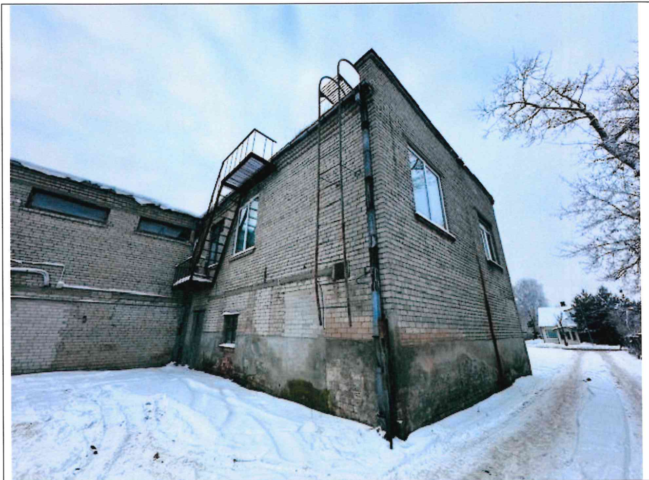
Foto lentelės prie 2026 m. sausio 14 d. patikrinimo akto Nr. ŽPa-5 tęsinys: ( data) (registracijos numeris)

Nuotraukos Nr. 6 (eilės numeris ir aprašymas)