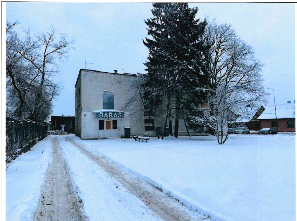
Foto lentelės prie 2026 m. sausio 14 d. patikrinimo akto Nr. ŽPa-5 tęsinys: ( data) (registracijos numeris)

Nuotraukos Nr. 3 (eilės numeris ir aprašymas)