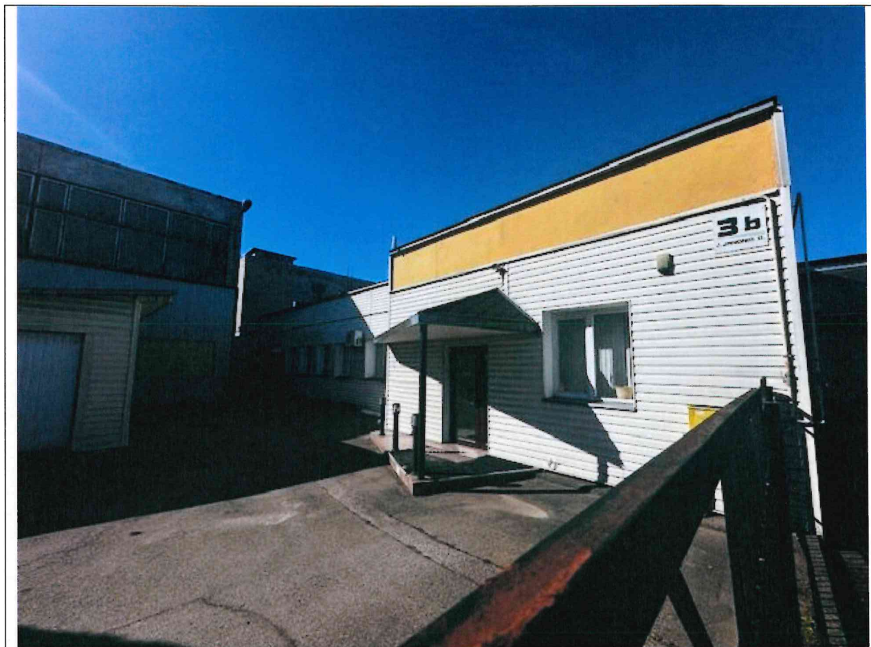
Foto lentelės prie 2026 m. gegužės 4 d. patikrinimo akto Nr. ŽPa-36 tęsinys: ( data) (registracijos numeris)

Nuotraukos Nr. 2 (eilės numeris ir aprašymas)