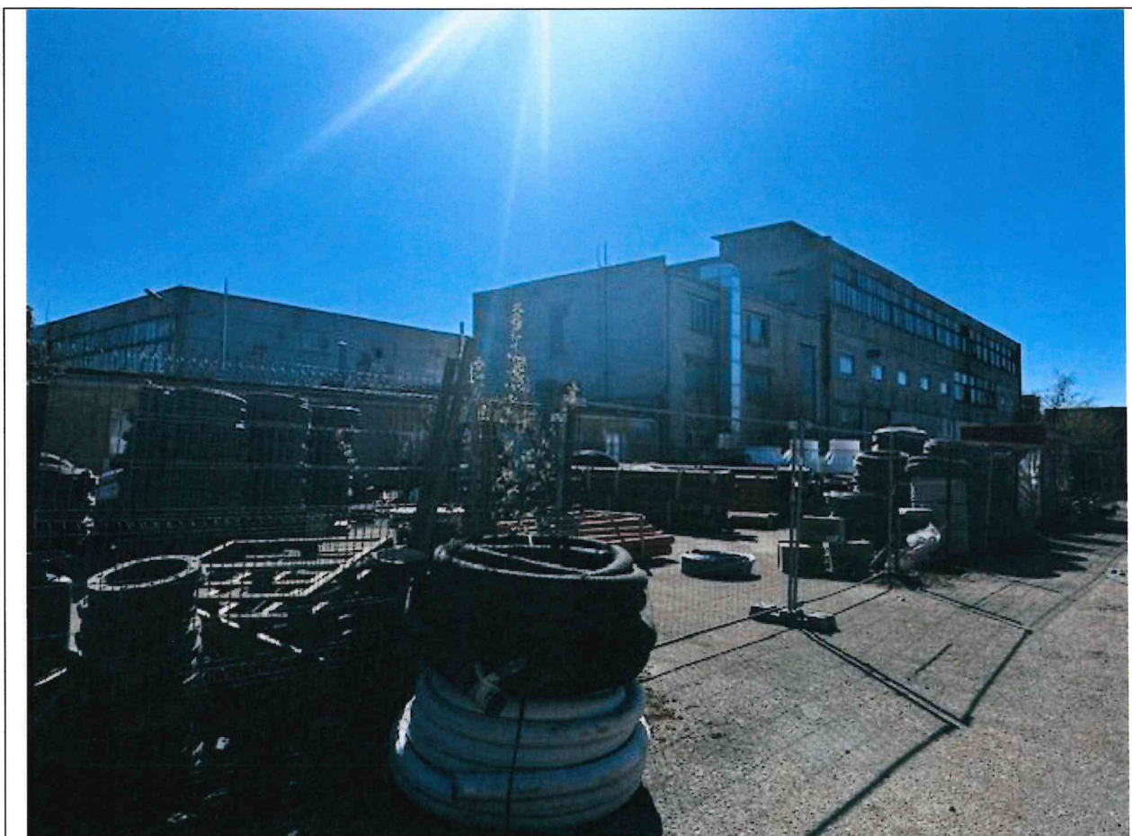
Foto lentelės prie 2026 m. gegužės 4 d. patikrinimo akto Nr. ŽPa-36 tęsinys: ( data) (registracijos numeris)

Nuotraukos Nr. 4 (eilės numeris ir aprašymas)